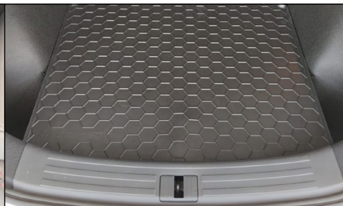
Ochranná vana do kufru